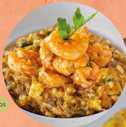
RISOTO DE CAMARÃO